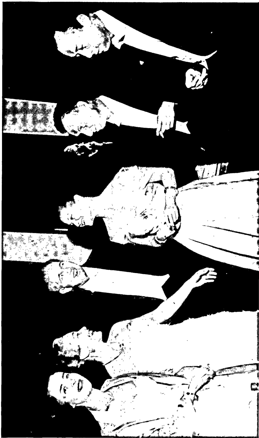
A la réception du Prix Nobel. Décembre 1957.