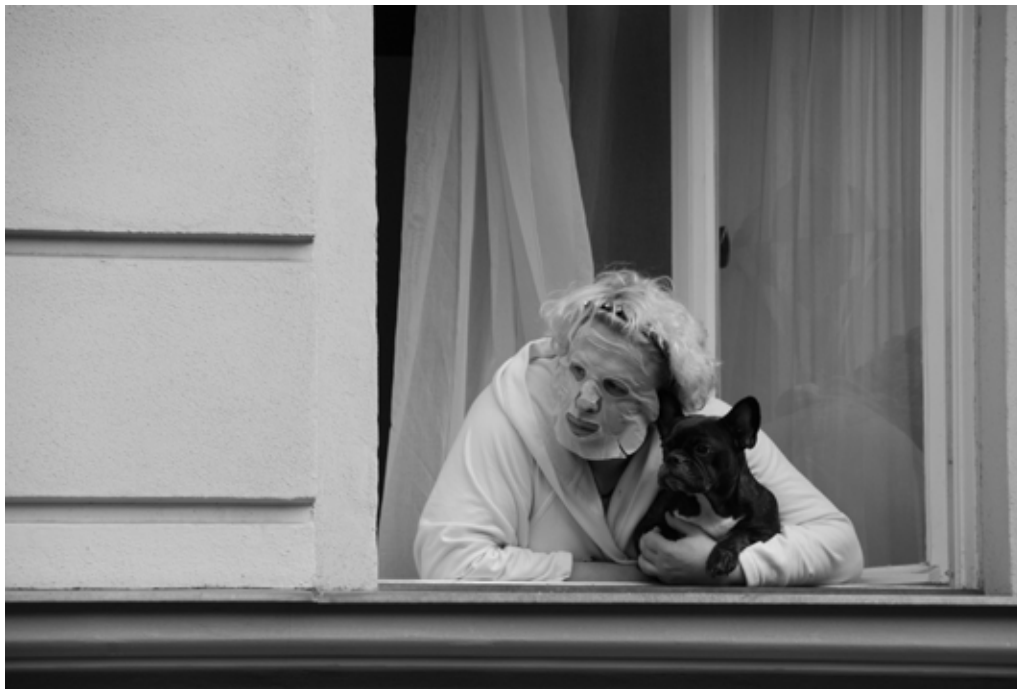
Masken könnten etwas Beschauliches an sich haben. Bei der gewaltsam wie propagandistisch erzeugten Corona-Massenpsychose geht es um Wirtschafts- und Machtintessen.