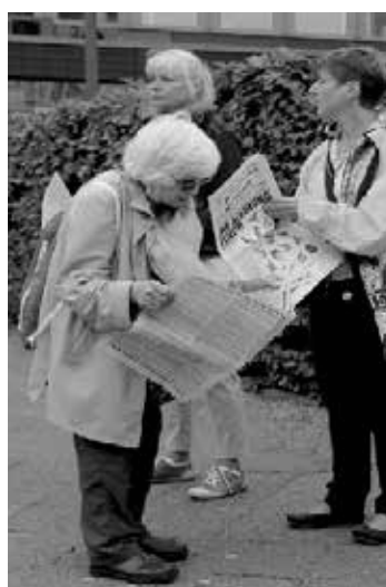
So sehen Siegerinnen auch aus: Grundgesetzverteidiger am Berliner Neptunbrunnen (l.) und am Wittenbergplatz (r.), 4. Juli 2020.

In Köln findet am Sonntag, bei uns ab 14:30 Uhr, unsere 15. Aktion auf dem Heumarkt statt. Angefangen hat es mit Spaziergängen, als quasi noch alles verboten war. Statt Demo haben wir uns für eine große Mahnwache entschieden, um die Polarisierung nicht zu bedienen. Wir schufen ein Forum Gleichgesinnter, um sich persönlich auszutauschen und Aktionen, wie gemeinsames maskenfreies Einkaufen, zu planen. Trotz der schwierigen Situation füllen wir die Mahnwache mit viel Herzesenergie, um Passanten zu erreichen und einzuladen. Das setzt kreative Energien frei: es entstehen Gedichte, Lieder und satirisches Puppenspiel, die neben kurzen Redebeiträgen unsere Aktivitäten prägen. Das Kernthema beschränkt sich auf das Thema der Grundrechte. Die Sehnsucht nach Freiheit, Menschlichkeit und Gerechtigkeit motiviert und trägt uns. Gemeinschaftlich wollen wir zum 1. August nach Berlin fahren und wünschen uns, dass auch dort Reichsbürgerideologie und Trittbrettfahrer keine Bühne finden. — Jay vom Netzwerk www.dsdg.org und nichtohneuns.de/regional